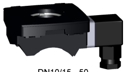
DN10/15 - 50