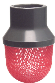
DN 15 - 50